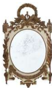
ESPELHO FRANCÊS ANTIGO

Descrição: espelho de bambu tratado com vidro.