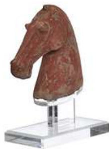
ESCULTURA CAVALO II

Descrição: estrutura Cabeça do pintor Ottone Zorlini em terracota, patinada. Brasil, Séc. XX.