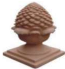
PINHA TERRACOTA I