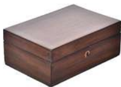
CAIXA VINTAGE III