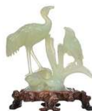
ESCULTURA PÁSSARO JADE

Descrição: esculturas de jade com formato de pássaros sobre tronco.