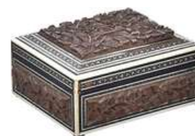
CAIXA VINTAGE VIII

Descrição: caixa de madeira, com chave, parte interna com divisórias.