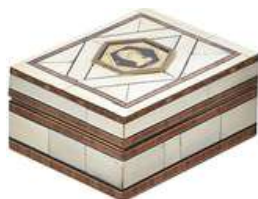
CAIXA VINTAGE VI