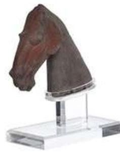
ESCULTURA CAVALO III

Descrição: cabeça de cavalo sobre acrílico.