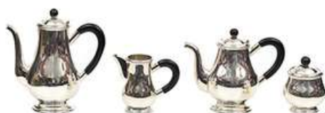
CJ. DE CHÁ (04 PÇS)