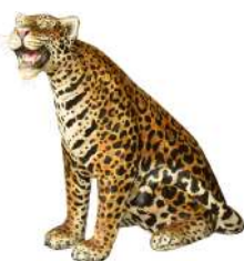
ESCULTURA ONÇA BOCA ABERTA I