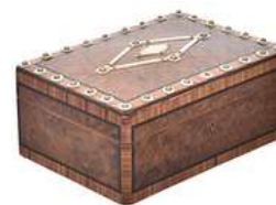
CAIXA VINTAGE V

Descrição: caixa de madeira, com chave, parte interna com divisórias.