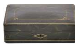
CAIXA VINTAGE EM COURO VERDE

Descrição: caixa com tampa basculante de madeira, parquetada, retangular com ornamentos por filetes em perolados e flores, de bronze dourado. França, séc. XX.