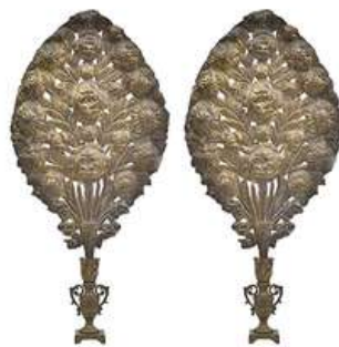
PAR DE PALMAS