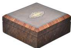
CAIXA VINTAGE IX

Descrição: caixa de madeira, com chave, parte interna forrada de veludo vermelho.