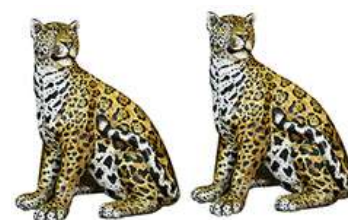
PAR ESCULTURA ONÇA

Descrição: escultura de cimento, representada por onça, pintada a mão.