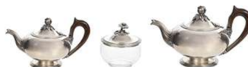
CJ. DE CHÁ (03 PÇS)

Descrição: serviço de chá e café de metal espessurado a prata, St. James, com cabos de madeira, composto de bule para chá, leiteira, açucareiro e recipiente para sachê.