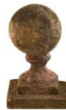
PINHA TERRACOTA II

Descrição: obra de Z'Figueiredo , escultor desafia condições com suas obras em concreto e barro, que combinam leveza e peso, figuração e arrojo, com característica única do autor.