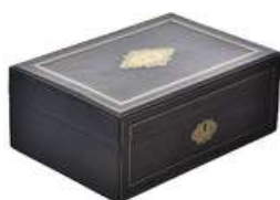
CAIXA DE MADEIRA VINTAGE IV

Descrição: caixa de madeira, com chave, parte interna forrada de veludo verde claro.