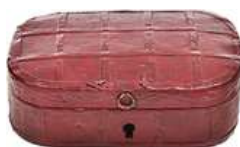
CAIXA VINTAGE DE COURO

Descrição: caixa antiga de madeira trabalhada, com tampa, base interna revestida em couro, tonalidade verde. acompanha chave, vendida no estado.