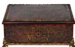
CAIXA PORTA JÓIAS