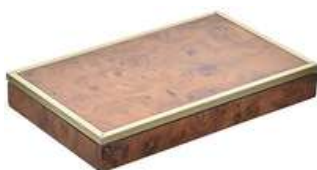
CAIXA VINTAGE VII

Descrição: caixa de madeira, com chave, parte interna forrada de veludo vermelho.