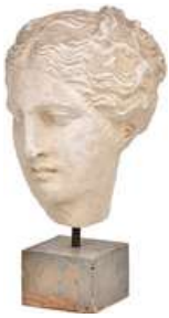
ESCULTURA ROMANA IV