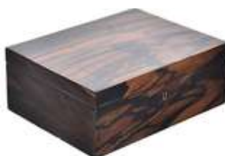
CAIXA VINTAGE I

Descrição: caixa antiga de madeira com tampa, parte externa revestida em couro, não acompanha chave.