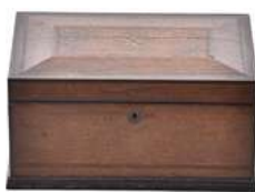
CAIXA PARA JÓIAS

Descrição: caixa de madeira, com chave, parte interna forrada de veludo azul.