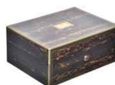
CAIXA VINTAGE II

Descrição: caixa de madeira, com chave, parte interna forrada de veludo preto.