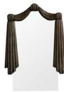
ESPELHO ENTALHADO PATINA

Descrição: antigo espelho com moldura de madeira entalhada em croisè, patinada, com corbeilles. Estilo neoclássico. França, séc. XVIII / XIX.