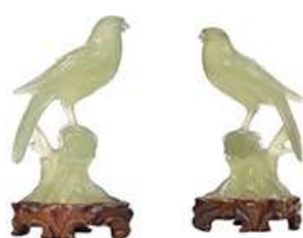
PAR DE PÁSSAROS JADE