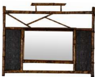
ESPELHO DE BAMBU